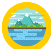
Healthy oceans, seas, coastal and inland waters