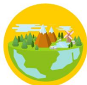
Adaptation to climate change, including societal Transformation

В Програмі визначено п'ять Місій з амбіційними цілями, дії в рамках яких сфокусовано на подолання викликів, які мають вплив на життя людини. Взаємодія науковців, суспільства, політиків, експертів тп