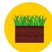
Soil health and food