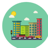
Climate-neutral and smart cities